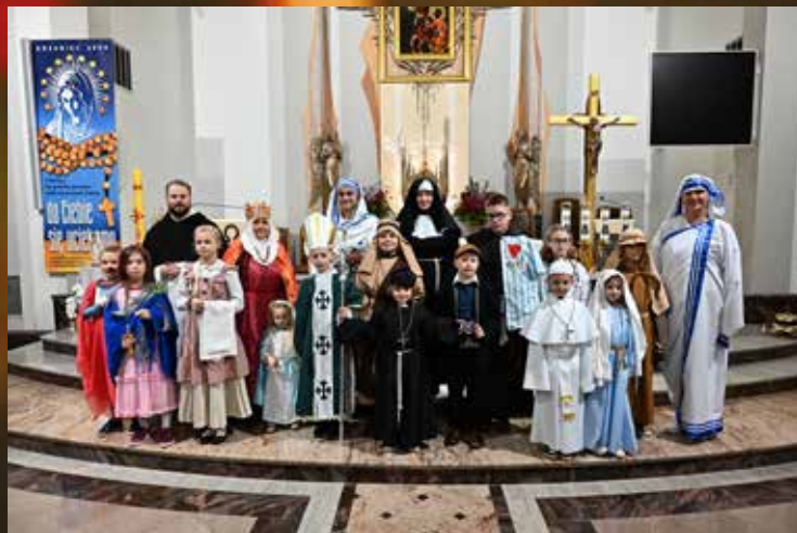
WIECZÓR ŚWIĘTYCH - 29.10.2024