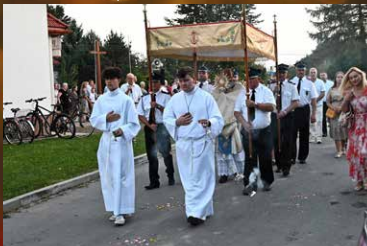
ODPUST PARAFIALNY - 26.08.2024