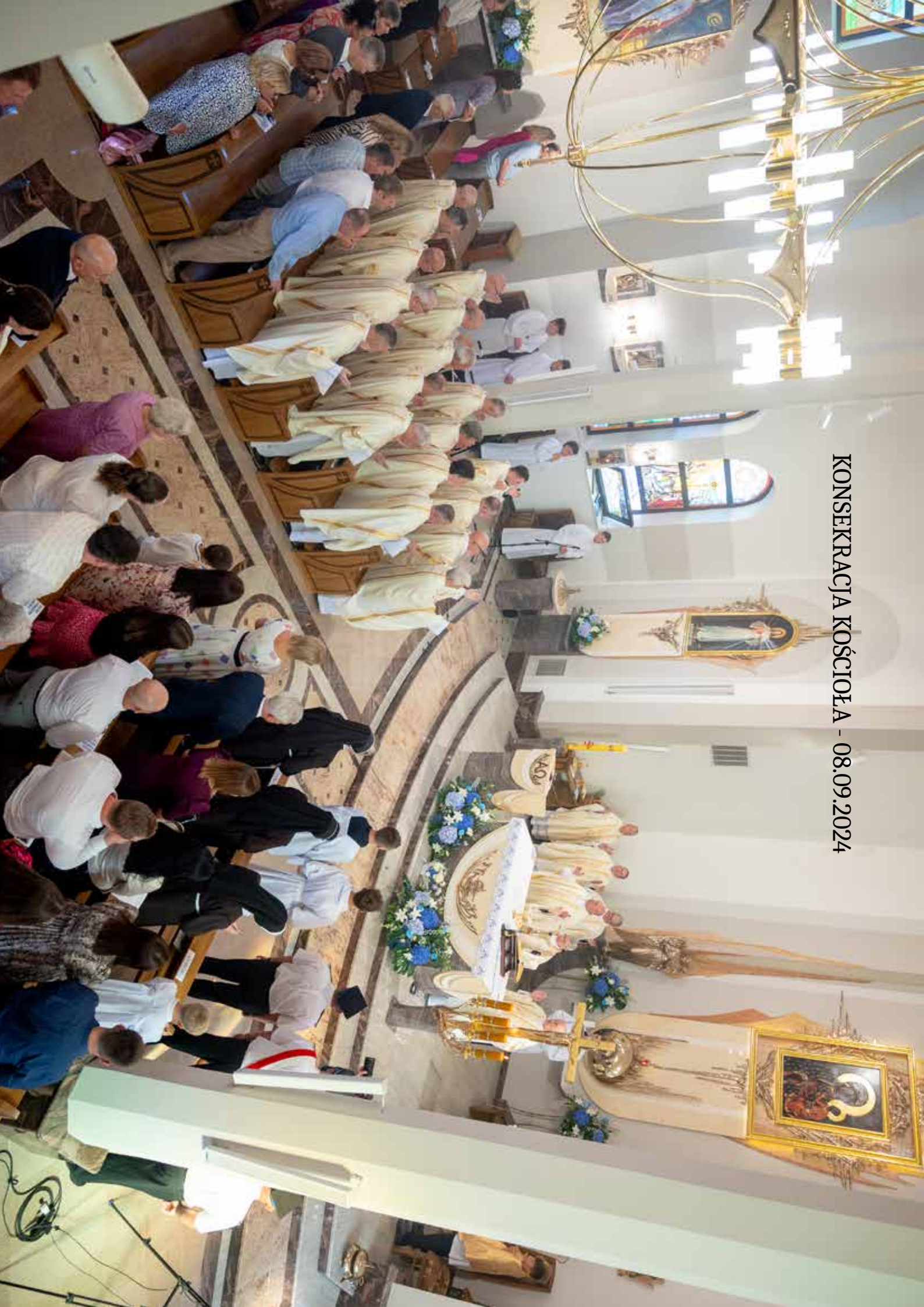
KONSEKRACJA KOŚCIOŁA - 08.09.2024