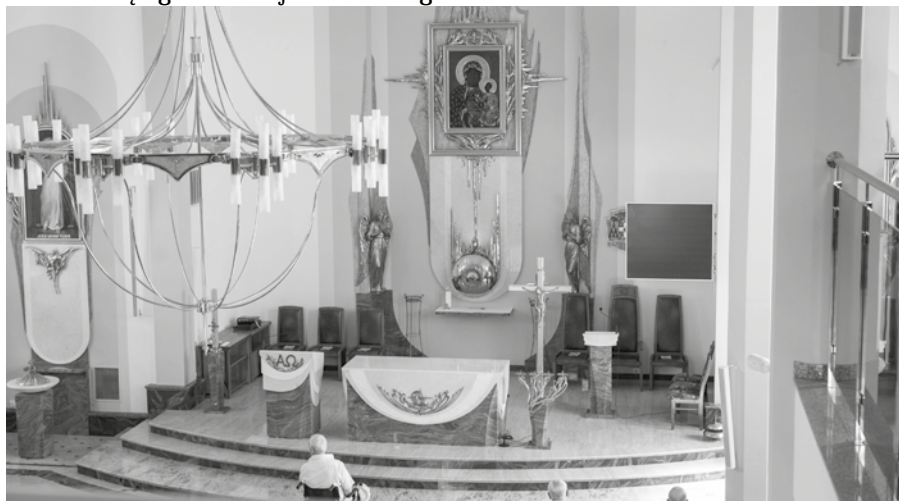
NOWE KRZESŁA I STOLIKI W PREZBITERIUM