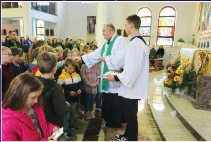
POŚWIĘCENIE RÓŻAŃCÓW DLA DZIECI KLAS III