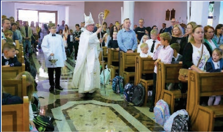
KS. BISKUP POŚWIĘCA PRZYBORY SZKOLNE DZIECIOM KLAS I