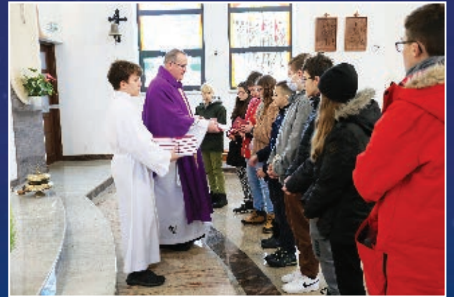
POŚWIĘCENIE KSIĄŻECZEK DLA MŁODZIEŻY KLAS VII