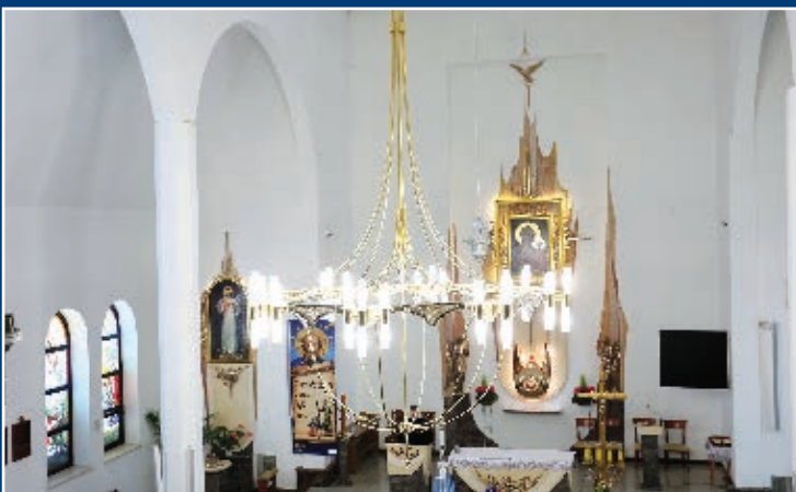
NOWY ŻYRANDOL W KOŚCIELE