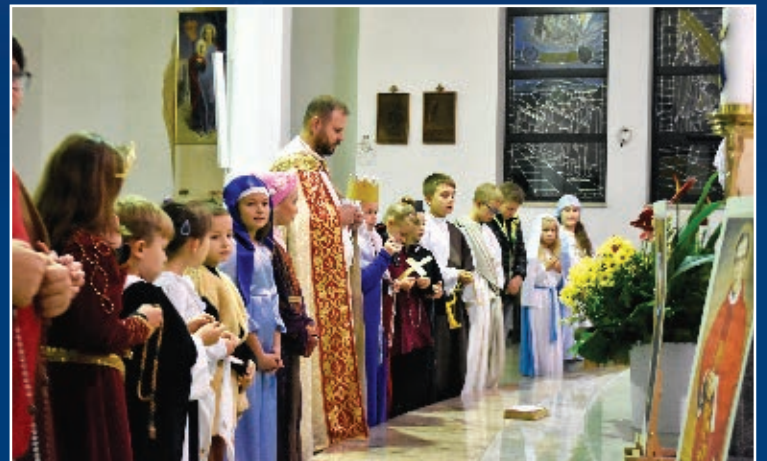
WIECZÓR ŚWIĘTYCH - 30.10.2022