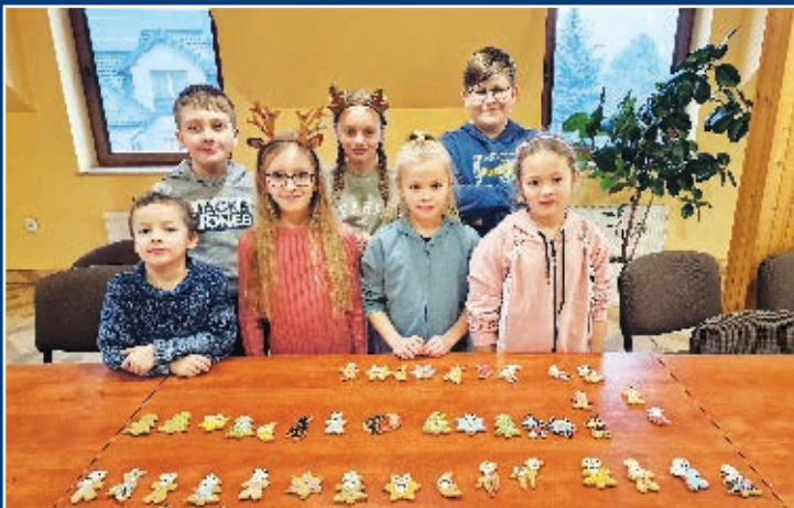
SPOTKANIE OAZY DZIECI BOŻYCH