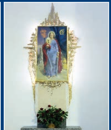
OŁTARZE BOCZNE: ŚW. JÓZEFA I ŚW. BARBARY