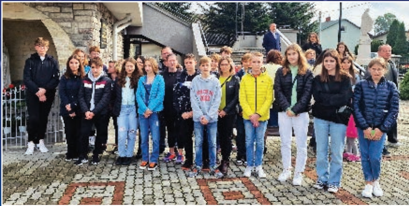
KANDYDACY DO BIERZMOWANIA W SIEDLISKACH