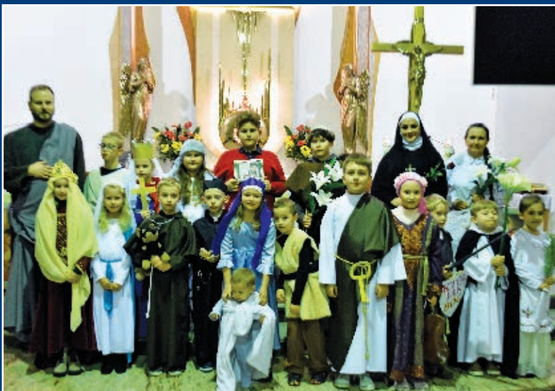
WIECZÓR ŚWIĘTYCH - 30.10.2022