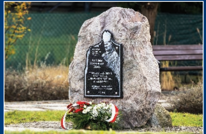
POŚWIĘCENIE TABLICY NA SKWERZE KS. INFUŁATA STANISŁAWA MACA - 12.11.2022