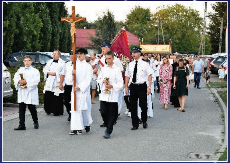
ODPUST PARAFIALNY - 26.08.2022