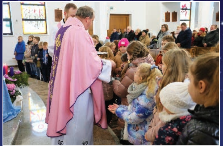
POŚWIĘCENIE MEDALIKÓW DLA DZIECI KLAS III