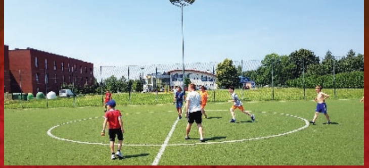
Wakacje z Bogiem - LSO