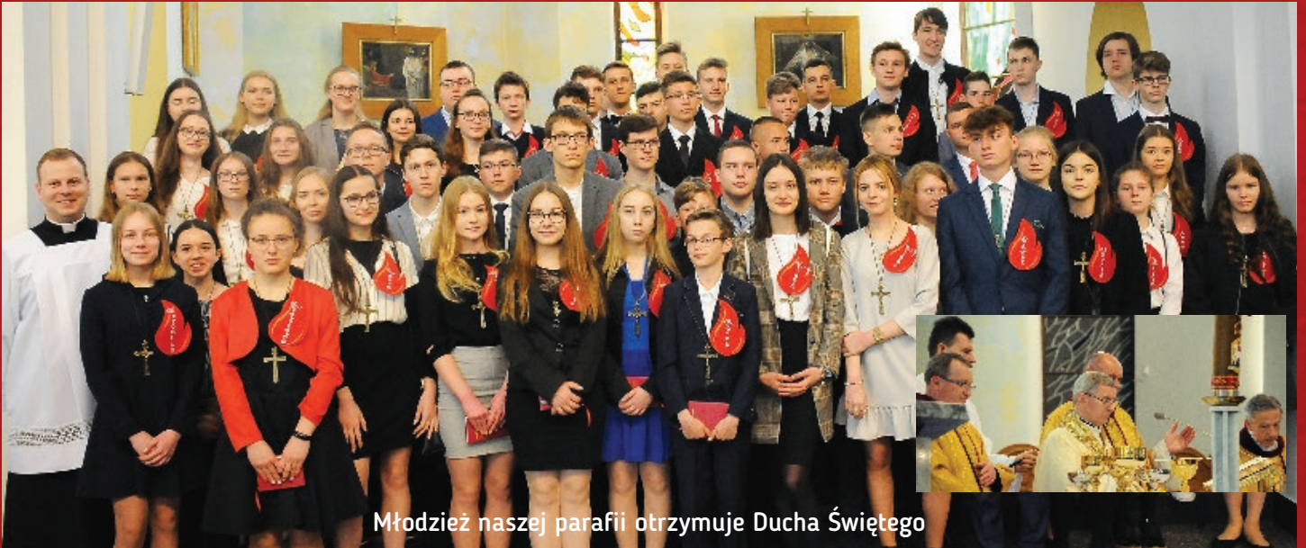
Młodzież naszej parafii otrzymuje Ducha Świętego