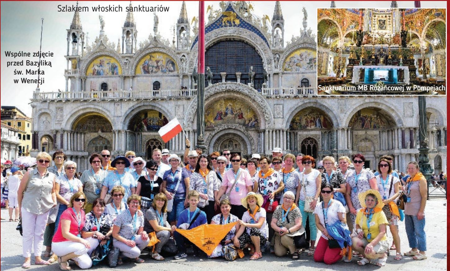
Sanktuarium MB Różańcowej w Pompejach